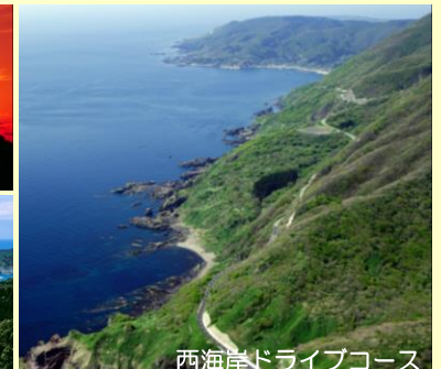
西海岸ドライブコース