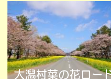
大瀧村菜の花ロード