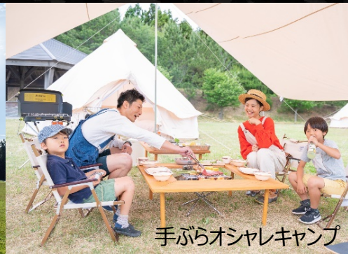
手ぶらオシャレキャンプ