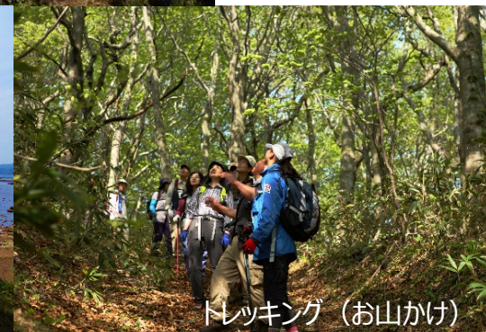
トレッキング (お山かけ)