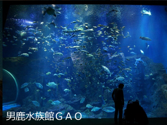
男鹿水族館 G A O