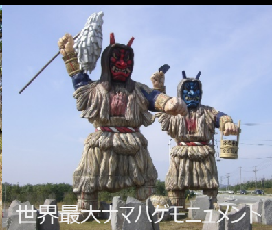
世界最大なまはげモニュメント