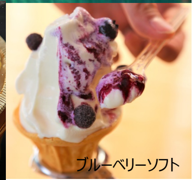
ブルーベリーソフト