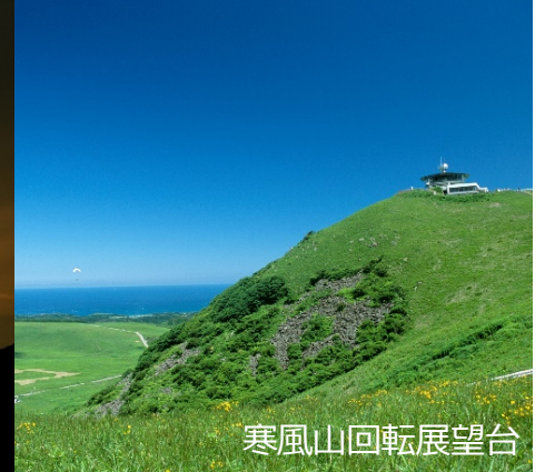
寒風山回転展望台