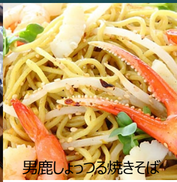
男鹿しよつる焼きそば