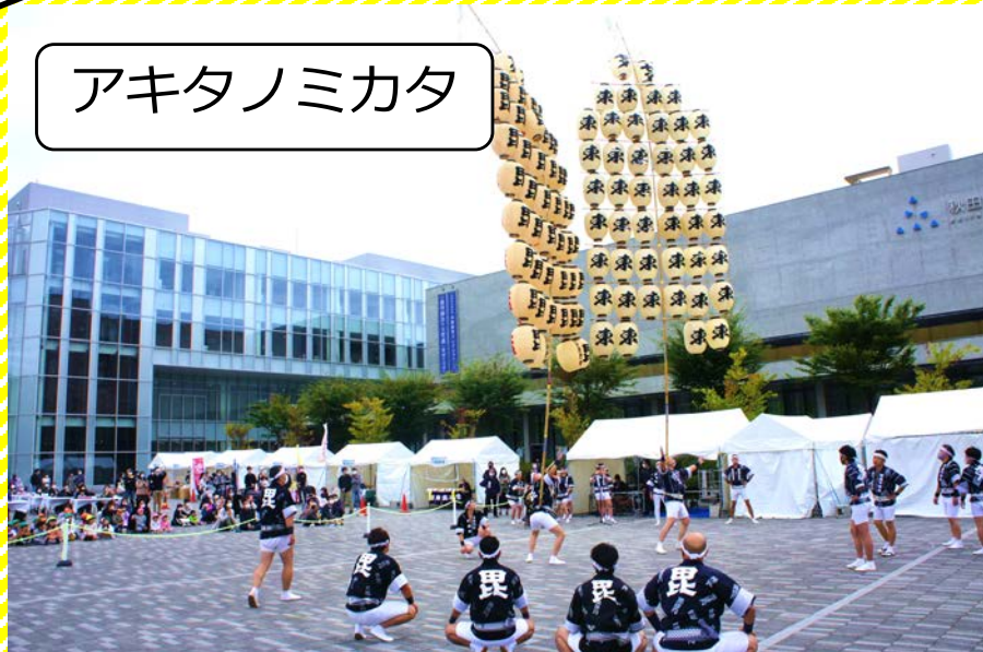
羽州街道歴史まつり