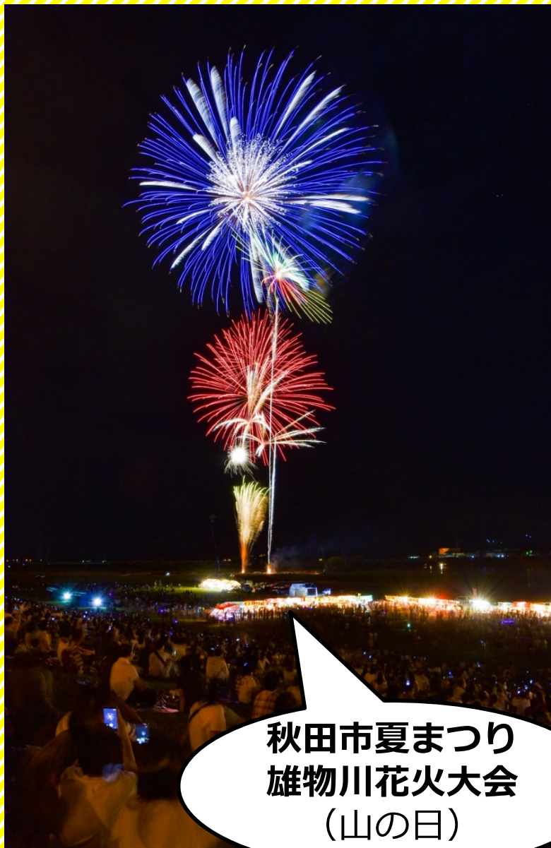
秋田市夏まつり 雄物川花火大会 (山の日)