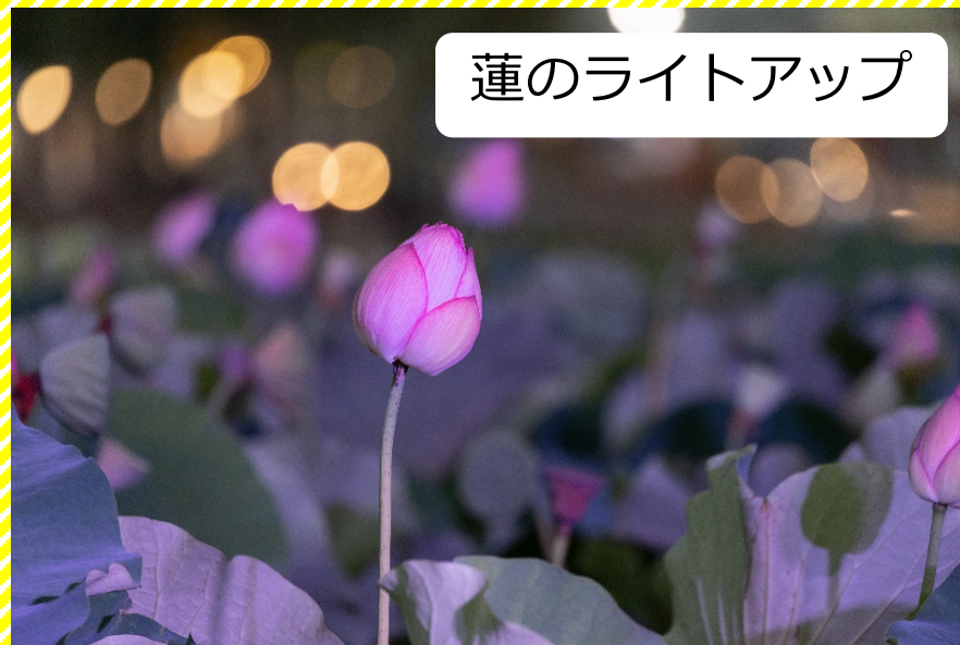
蓮のライトアップ