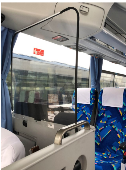
飛沫防止アクリル板 運転席後ろに設置