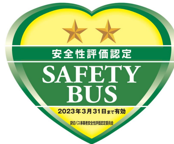
秋北タクシー（二ツ星）