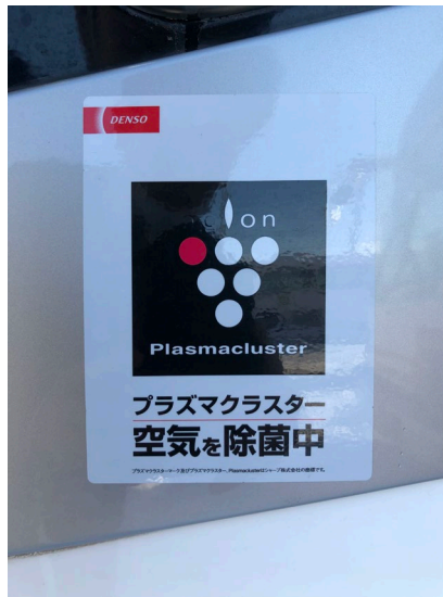
除菌イオン発生装置