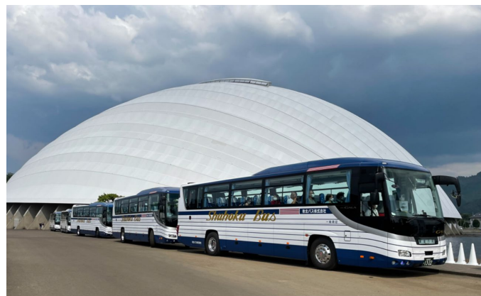
大規模イベントの シャトルバス運行