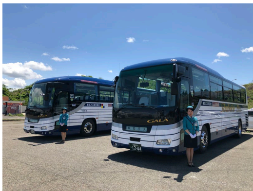
バスガイド付で お客様のお出迎え