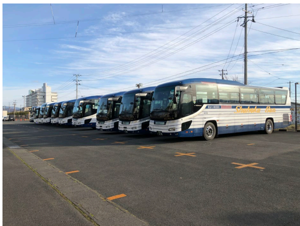
学生進学イベント 複数校の運行