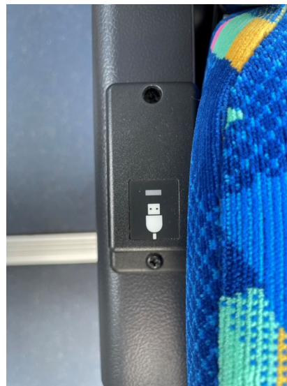
充電用USBポート 全座席に設置